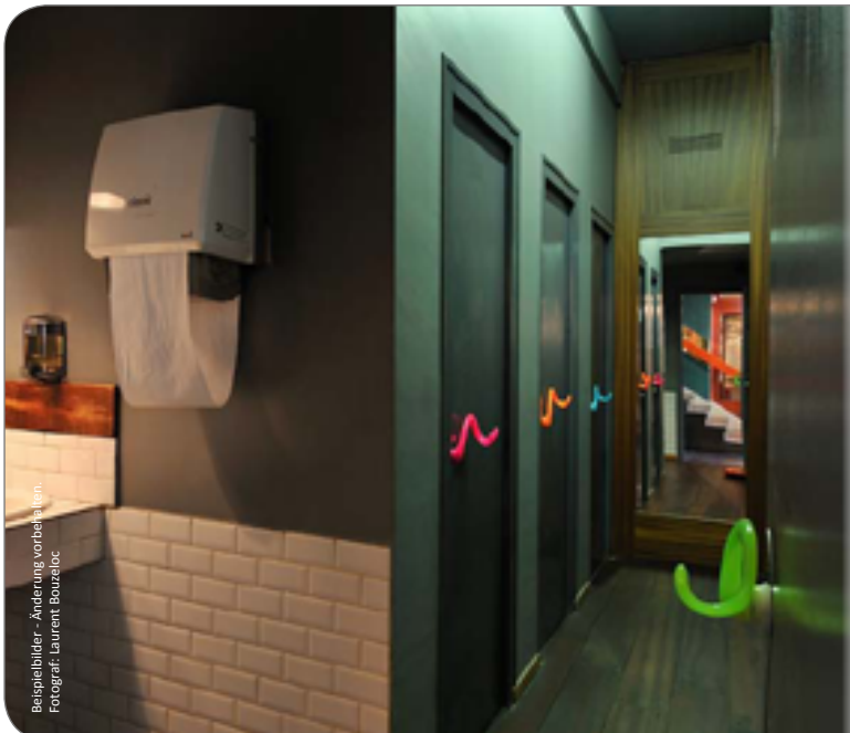
Beispielbilder - Änderung vorbehalten.