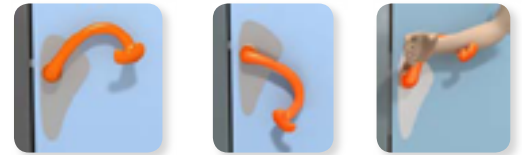
• Die Einstellbarkeit von "normaler" und behinderten-gerechter Position ist jederzeit und einfach möglich. • Eine freihändige Benutzung ist jederzeit gewährleistet